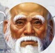
LAO-TSEU en 531 avant notre ère

En Grèce, les grands philosophes classiques Socrate, Platon et Aristote se sont efforcés d'établir une norme d'éthique et de connaissance humaines .