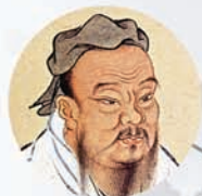
CONFUCIUS 551 à 479 avant notre ère

En Chine, Confucius est apparu, enseignant un humanisme éthique hautement développé. Lao-Tseu a établi la tradition du taoïsme .