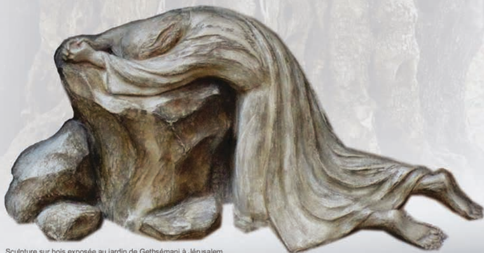
Sculpture sur bois exposée au jardin de Gethsémani à Jérusalem

Même si Jésus les a réveillés trois fois, ils ont continué à dormir et n'ont donc pas pu recevoir l'inspiration et la puissance de Dieu.