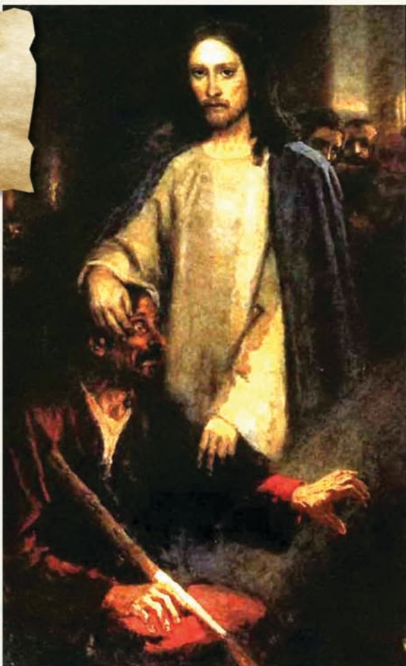
Vasily Surikov, Jésus-Christ guérit l'aveugle de naissance

D'autre part, l'œuvre de Jésus suscita un grand mécontentement parmi les dirigeants du judaïsme; ils se sont mis à le considérer comme un complice du diable et ont empêché les gens de le suivre. Après un certain temps, ils ont cherché une occasion de tuer Jésus (Matthieu 12:24). « Celui-là n'expulse les démons que par Bézélzéboul, le prince des démons. »