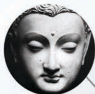
GAUTAMA BOUDDHA vers 558 à 491 avant notre ère

De plus, environ quatre siècles avant Jésus-Christ, Dieu a préparé intérieurement le monde pour la venue du Messie à travers des mouvements religieux et éthiques .