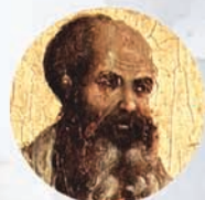
MALACHIE en 400 avant notre ère