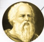
SOCRATE 470/469 à 399 avant notre ère

Par ces moyens et bien d'autres, Dieu a préparé le terrain pour l'établissement de son royaume sur la terre, le royaume dont Jésus a si souvent parlé.