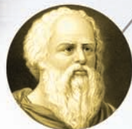
ΣΩΚΡΑΤΗΣ 470/469 - 399 π.Χ.

Ο Μαλαχίας, ο συγγραφέας του τελευταίου βιβλίου της Παλαιάς Διαθήκης, προφήτευσε ότι ο Ηλίας, ο διάσημος προφήτης που έζησε τον 9ο αιώνα π.Χ., θα επέστρεφε στο Ισραήλ "πριν έρθει η ημέρα του Κυρίου", δημιουργώντας έτσι συγκεκριμένες μεσσιανικές προσδοκίες στους Εβραίους.