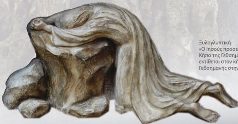
Ξυλογλυπτική «Ο Ιησούς προσεύχεται στον Κήπο της Γεθσημανής», εκτίθεται στον κήπο της Γεθσημανής στην Ιερουσαλήμ

Παρότι ο Ιησούς ξύπνησε τους αποστόλους τρεις φορές, αυτοί πάλι αποκοιμήθηκαν και επομένως δεν μπόρεσαν να λάβουν έμπνευση από το Θεό. Ο Ιησούς έμεινε μόνος του, δεν υπήρχε κανείς να τον υποστηρίξει. Ο δρόμος του σταυρού ήταν αναπόφευκτος.