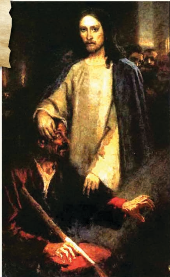
Βασίλη Σουρικόβ “Ο Ιησούς θεραπεύει τον εκ γενετής τυφλό”

Ο Ιησούς επένδυσε πλήρως όλη του την καρδιά και ενέργεια για να κάνει τους ανθρώπους να πιστέψουν σε αυτόν. Κήρυξε και δίδαξε ακούραστα. Όσο πιο προφανές γινόταν, ότι οι Ισραηλίτες δεν μπορούσαν να πιστέψουν στα λόγια του, τόσο περισσότερο προσπάθησε να τους αποδείξει ποιός είναι κάνοντας θαύματα. Θεράπευσε αρρώστους, έδωσε φως στους τυφλούς, εκδίωξε κακά πνεύματα. Δυστυχώς όμως, μόνο λίγοι από αυτούς που είχαν θεραπευτεί έγιναν ενεργοί και δραστήριοι οπαδοί του Ιησού. Εκτός από αυτό, οι ηγέτες του Ιουδαϊσμού ήταν τόσο ενοχλημένοι και εκνευρισμένοι από το έργο του Ιησού, που άρχισαν να τον θεωρούν ως συνεργό του διαβόλου και εμπόδιζαν τους ανθρώπους να τον ακολουθήσουν. “Αυτός δεν διώχνει τα δαιμόνια αλλιώς, παρά με τη δύναμη του Βεελζεβούλ, του άρχοντα των δαιμονίων.” (Μτ 12:24). Μετά από λίγο καιρό, άρχισαν να αναζητούν μια ευκαιρία για να τον σκοτώσουν.