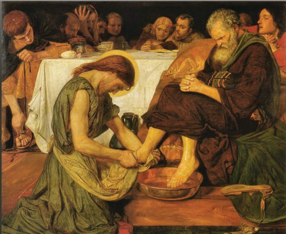
Πίνακας: Φορντ Μάντρεξ Μπράουν, "Ο Χριστός πλένει τα πόδια του Πέτρου"