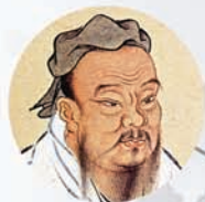
ΚΟΜΦΟΥΚΙΟΣ 551 - 479 π.Χ.

Στην Ινδία, ο πρίγκιπας Σιντάρτα Γκαουτάμα (Βούδας) απέρριψε τις υλικές ανέσεις και αναζήτησε τον αληθινό τρόπο ζωής. Από το παράδειγμα και τη διδασκαλία του αναπτύχθηκε ο Βουδισμός, ο οποίος έγινε μια από τις πιο σημαντικές θρησκείες στην Ανατολή.