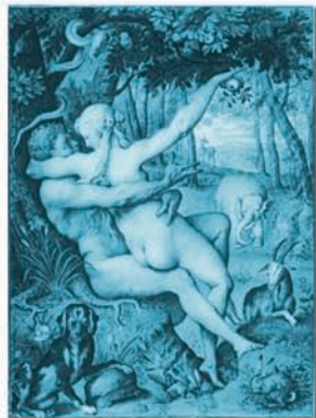
Daniel Froschl: "Αδάμ και Εύα"

Ο καρπός που έφαγαν οι πρωτόπλαστοι δεν θα μπορούσε να είναι ένας πραγματικός βρώσιμος καρπός. Ο Ιησούς είπε: "τον άνθρωπο δεν τον κάνει ακάθαρτο ό,τι μπαίνει στο στόμα του, αλλά ό,τι βγαίνει από το στόμα του, αυτό κάνει τον άνθρωπο ακάθαρτο" (Μτ 15:11). Επιπρόσθετα, ο θάνατος που προήλθε από την βρώση του καρπού δεν ήταν ο φυσικός θάνατος (ο Αδάμ και η Εύα συνέχισαν να ζουν και μετά την Πτώση), αλλά ο πνευματικός θάνατος, ο οποίος σημαίνει το χωρισμό των ανθρώπων από τον Θεό.