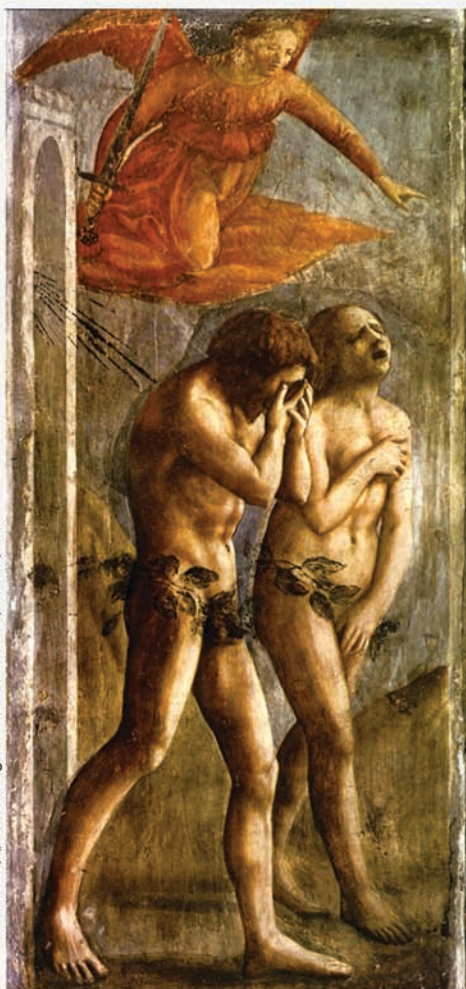
Masaccio, „Verreibung aus dem Paradies“, Fresko; 1427