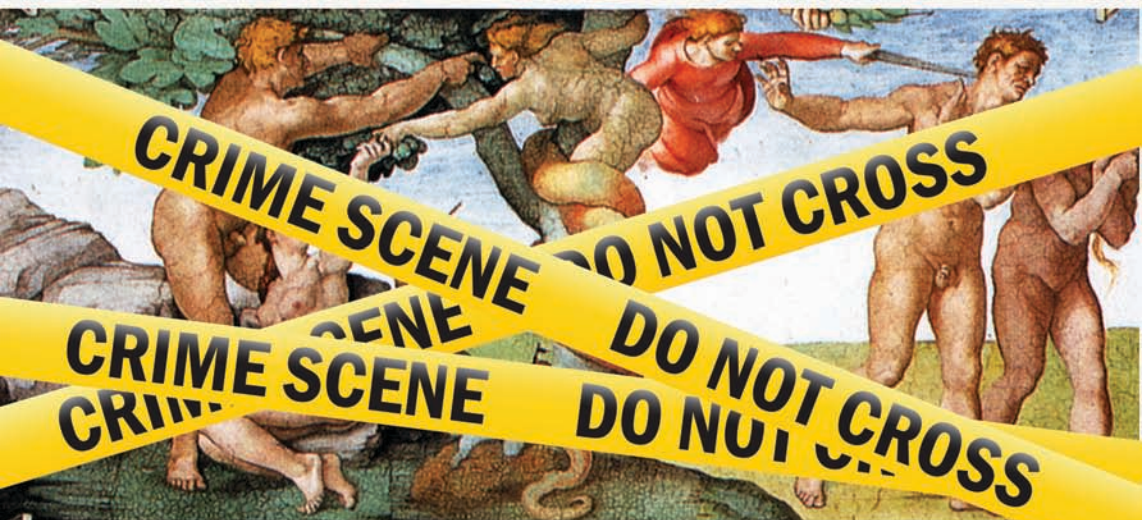
Μιχαήλ Άγγελος: Η Πτώση του ανθρώπου και η εκδίωξη από τον κήπο της Εδέμ

Κείμενα από διάφορες Γραφές περιλαμβάνουν διαφορετικές παραλλαγές στο θέμα της ανθρώπινης Πτώσης. Οι Θείες Αρχές παρουσιάζουν μια ριζοσπαστική εξήγηση σχετικά με την πραγματική αιτία του κακού, που σε όλες τις μεγάλες θρησκείες έχει περιγραφεί με σύμβολα. Η ιστορία της Γένεσης, στην οποία εστιάζεται η εξήγηση των Θείων Αρχών, είναι ίσως η πιο γνωστή και η πιο διαφωτιστική.