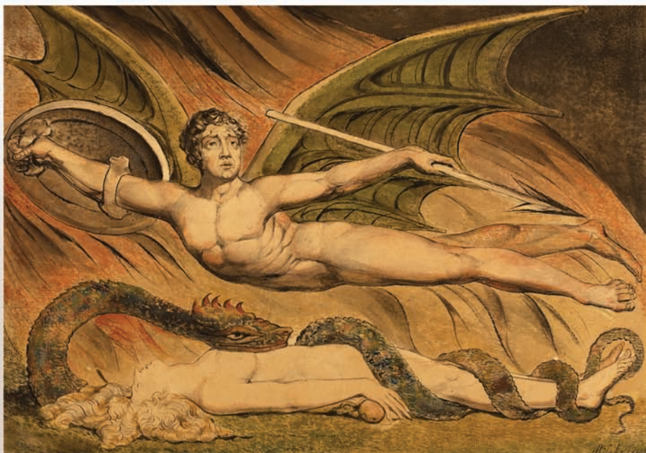
Ουίλιαμ Μπλέικ: " Ο Σατανάς θριαμβολογεί πάνω από την Εύα " (Satan exulting over Eve)

Εξαιτίας αυτού, ένας φαύλος κύκλος άρχισε. Τελικά, ο Εωσφόρος απήφησε τον Θεό και τον ουράνιο νόμο συμμετέχοντας σε μια σεξουαλική σχέση με την Εύα. Αν και η Εύα, στην αρχή, αισθάνθηκε φόβο, άγχος και σύγχυση, άφησε τον εαυτό της να παρασυρθεί και να συνάψει μια σεξουαλική σχέση με τον αρχάγγελο. Αυτό ήταν δυνατό να γίνει, επειδή η Εύα, πριν από την Πτώση, μπορούσε να αλληλεπιδρά με τον πνευματικό κόσμο τόσο εύκολα όσο και με τον φυσικό κόσμο μέσω των πνευματικών της αισθήσεων. Ήταν μια εντελώς πραγματική εμπειρία. Στην ένωσή της με τον Εωσφόρο, η Εύα έλαβε τα εγωιστικά και κακά πνευματικά του στοιχεία.